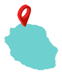
L'île de La Réunion