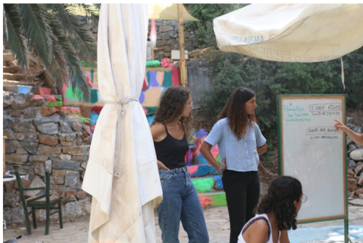
Un des ateliers du Samos Legal Centre

"L'entretien s'est bien passé. L'attente a été très dure, car je ne pouvais pas travailler ou faire quoi que ce soit pour me distraire. Et j'avais toujours mal, alors j'étais heureux quand ils m'ont finalement transféré de Samos , et le fait que vous m'ayez donné les coordonnées des avocates où je suis maintenant m'a beaucoup aidé. Je vous suis reconnaissant pour ce soutien qui m'a aidé à comprendre exactement comment se déroulerait l'entretien, car la préparation correspondait aux questions de l'entretien."